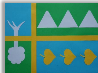
Vlajka Horních vsí